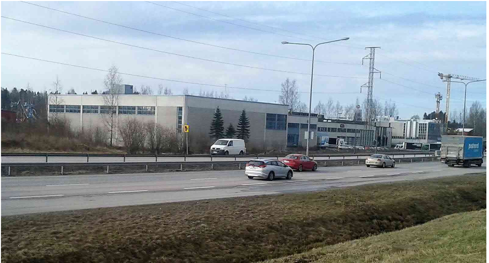
Kiintiestö kehä III takaa kuvattuna, huhtikuu 2017