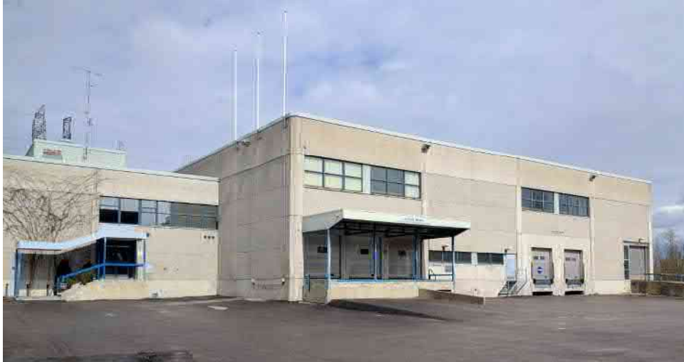
Riihikuja 5, 01720 VANTAA (kuva 2017-05)

Teollisuus- ja varastorakennus. Rakennusvuosi 1985 , laajennettu 1989