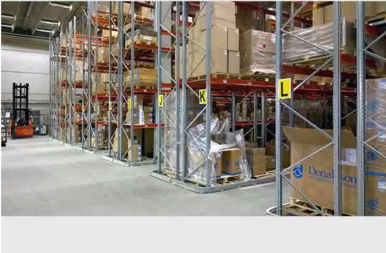
Hyllyjä aiemman käyttäjän aikaa (tyhjät hyllyt vuokranantajalla)